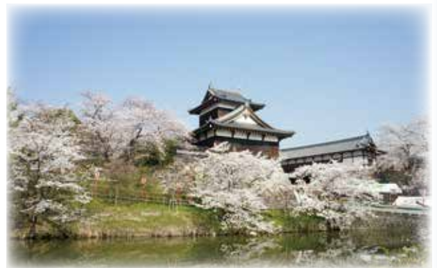
大和郡山城（続日本100名城）